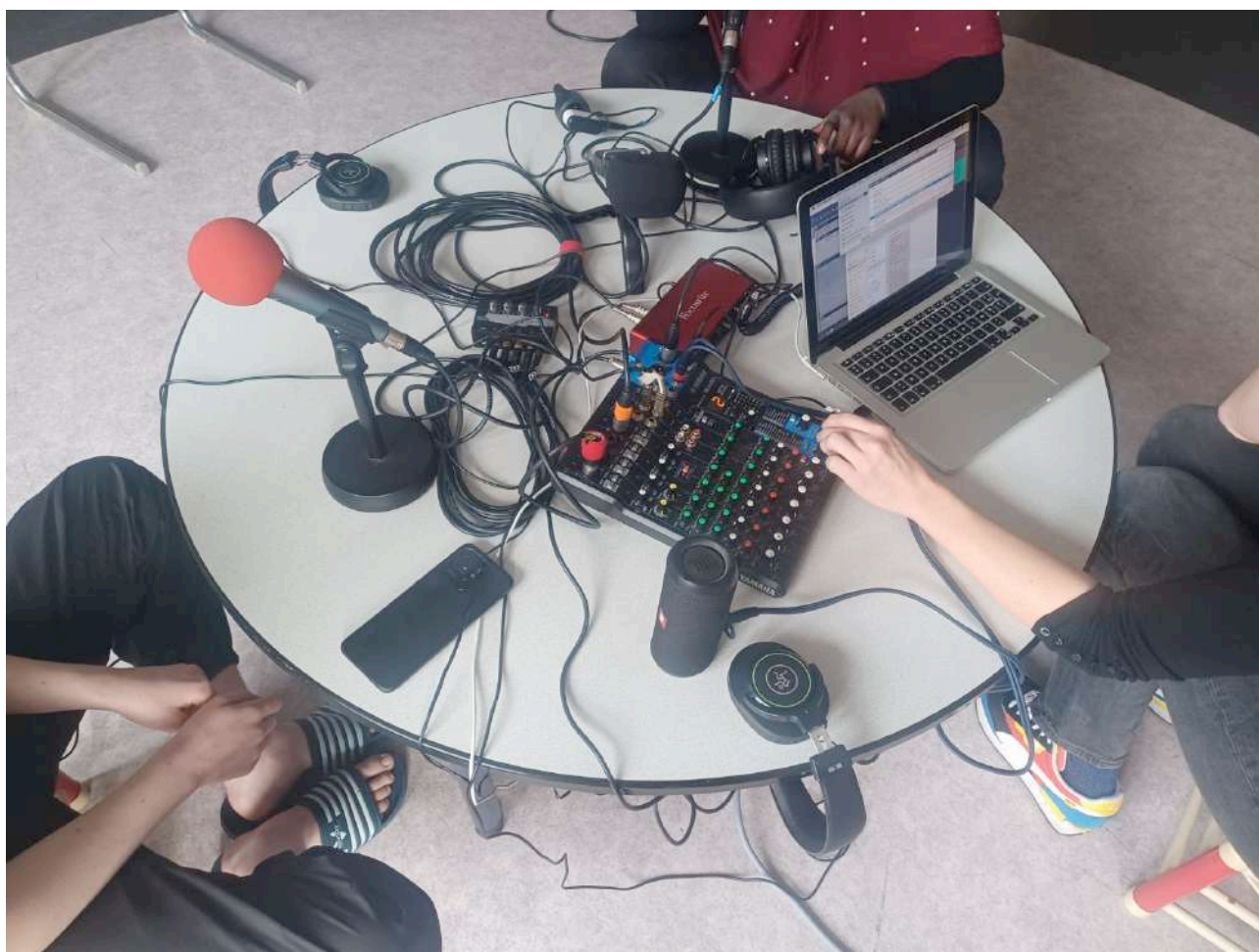
TRAVAIL D'ATELIER MENÉ PAR LA COMPAGNIE BASSES FRÉQUENCES – FOYER CHARLES FREY STRASBOURG

Construire des actions artistiques en relation avec ces thématiques, comme nous avons pu le faire dans certaines structures, est aussi une opportunité de nourrir notre travail de création.