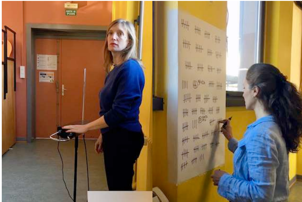
REPRÉSENTATION AU LYCÉE COUFFIGNAL - STRASBOURG

Deux comédiennes accueillent les spectateurs et spectatrices à l'entrée de la salle et les invitent à s'asseoir, une fois passé le point de contrôle, matérialisé par un thérémine. A chaque passage, un son se produit, comme un rappel des systèmes de contrôle des prisons, ou de ceux que l'on trouve à l'entrée de nombreux lieux publics. De l'animatrice radio au professeur d'université en passant par une femme de détenu, les comédiennes endossent plusieurs rôles; elles glissent leurs corps et leurs voix dans une narration subjective, pour cheminer avec l'auditeur-spectateur. Le témoignage d'un ancien prisonnier les amène à se questionner sur le choix de certaines sociétés de ne pas sanctionner pénalement l'évasion. Le récit véridique d'une femme de détenu les plonge dans certaines grandes scènes d'évasion cinématographiques, tandis que la parole d'un jeune enfant les interroge sur la capacité que nous avons tous et toutes, à nous extraire parfois du quotidien, par notre imaginaire.