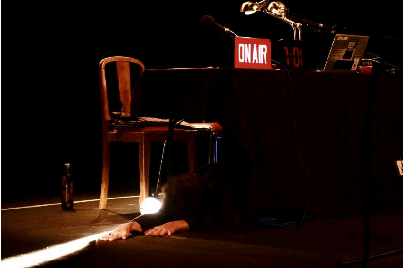
REPRÉSENTATION VELO THÉÂTRE, APT JANVIER 2025

elle écrit et réalise des fictions sonores à la prison des Baumettes à Marseille, ou avec un foyer de jeunes travailleurs à Avignon ( les Acteurs, Une histoire vraie ). Elle réalise le documentaire sonore Une vague rumeur , mené avec des enfants, pour le festival de musique Émergences .