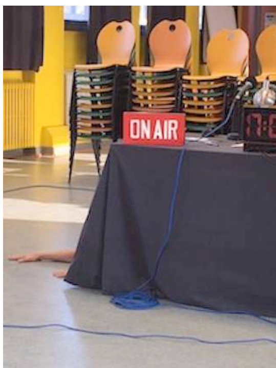
REPRÉSENTATION AU LYCÉE COUFFIGNAL - STRASBOURG

Lignes de fuite est une enquête théâtrale et radiophonique, qui explore le désir impérieux d'évasion, celui qui naît, entre quatre murs ou entre les parois de son propre corps. Archives, interviews, histoires d'évasions multiples et même quizz...une invitation à percer les murs !