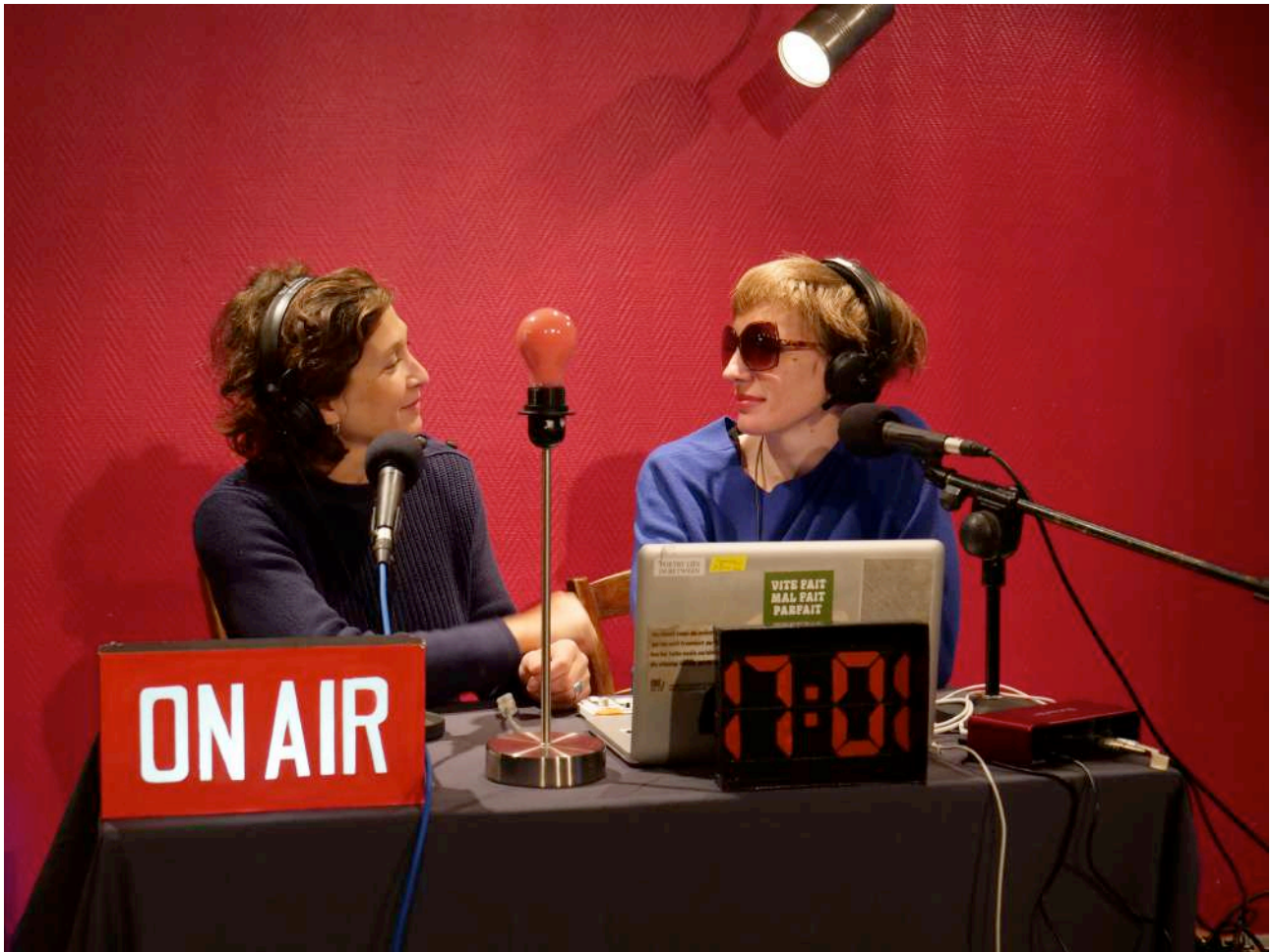
REPRÉSENTATION A L'OIGNON – LIEU ASSOCIATIF, SAILLANS